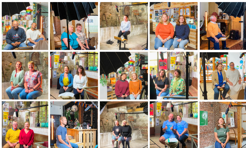
Quelques labellisés du Budget Citoyen lors des tournages vidéos.

De façon encore plus large, Pas-de-Calais Actif travaille de concert avec la Mission ESS et est à l'écoute des échanges et propositions émanant du Conseil Départemental de l'ESS (CDESS) dont certaines ont donné naissance à des dispositifs portés par Pas-de-Calais Actif. C'est notamment le cas de la plateforme départementale de financement participatif Propulsons!